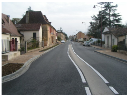
Traversée de Tuilières après travaux