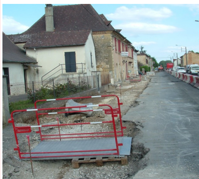
Traversée de Tuilières pendant travaux

La deuxième zone sera effectuée ultérieurement afin que la continuité de la traversée du bourg de Tuilières soit homogène et sécurisée.